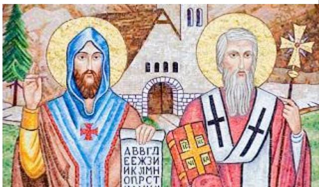
Cyryl i Metody

...Pani opowiadała nam o chrzcie Polski i o Mieszku I. Potem dała nam pytania do książek. My mieliśmy opowiedzieć kim byli Cyryl i Metody. Ci święci byli misjonarzami, głosili Ewangelię. Pod koniec lekcji można było wypożyczyć książkę. Bardzo nam się podobało.