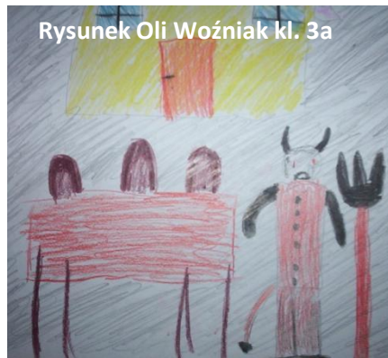
Rysunek Oli Woźniak kl. 3a