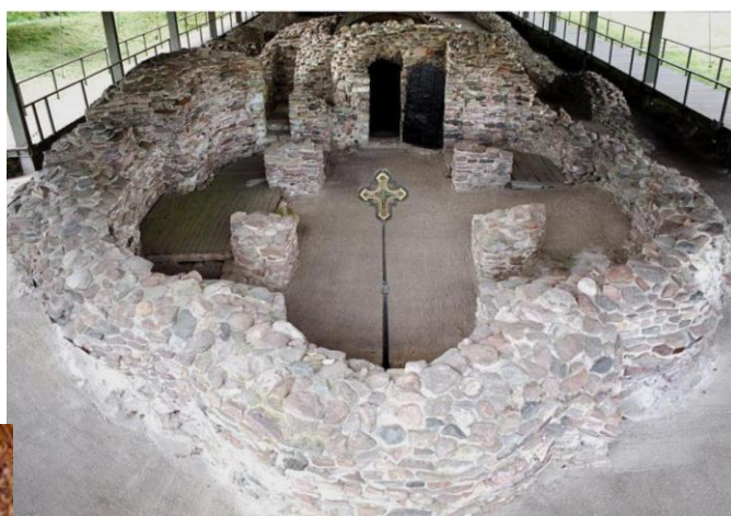
Przypuszczalne miejsce chrztu Mieszka I – Ostrów Lednicki