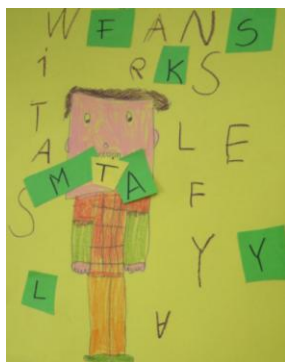
Prace uczniów klasy 1a

Osoby należące do klubu czytają książki i czasopisma dla dzieci. Jeśli jeszcze sami nie potrafią, pomaga im w tym rodzina. Każdy klubowicz został pasowany na Pożeracza Liter – otrzymał legitymację.