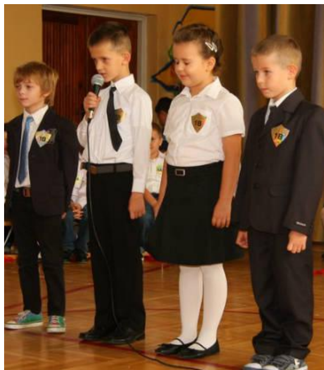
Wiersz o klasie sportowej uczniowie klasy 1b.