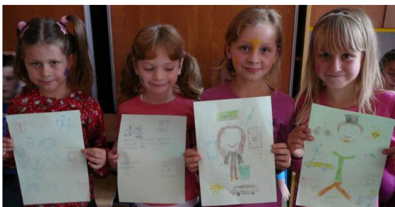
PRACE PLASTYCZNE Jak wygląda człowiek przedsiębiorczy?

Uczniowie poprzez zabawę poznali zasady handlu wymiennego, funkcjonowanie banku i giełdy. Uczyli się podejmować decyzje w zarządzaniu własnymi pieniędzmi, by być oszczędnymi. Wykonali także prace plastyczne obrazujące zapracowanych przedsiębiorców. Na zakończenie wychowawczynie wręczyła uczestnikom dyplomy ukończenia szkolenia.