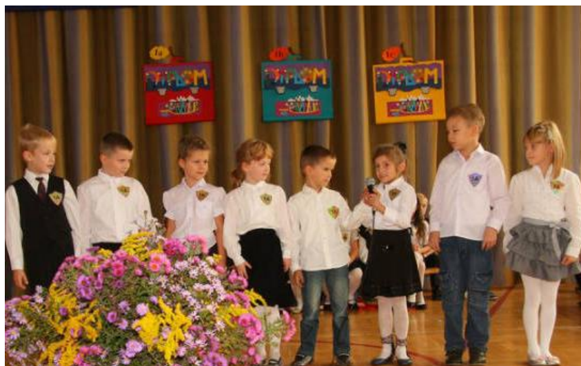
Uczniowie klasy 1a prezentują wiersz o kolegach.

Pierwszoklasiści otrzymali legitymacje szkolne oraz pamiątkowe dyplomy i teczki. Niespodzianką od rodziców były kolorowe kufereki wypełnione słodyczkami.