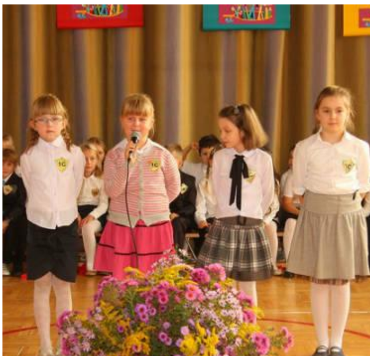
Uczniowie klasy 1c recytują wiersz o szkole.