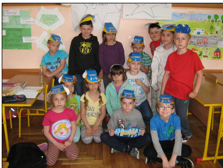
Uczniowie klasy II c także gotowi do wyprawy za miasto.