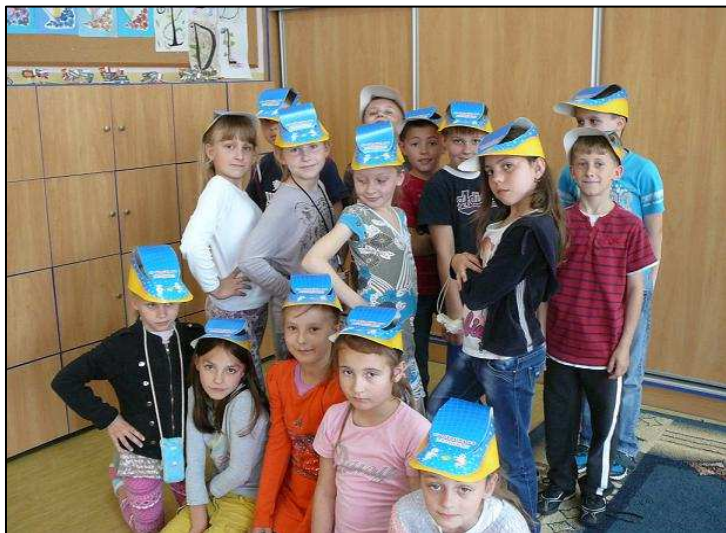
już jesteśmy gotowi – kl. II a