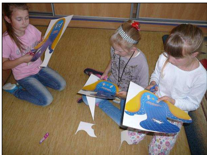
Szykujemy czapki na majówkę – bo słońce, więc pracujemy i ...