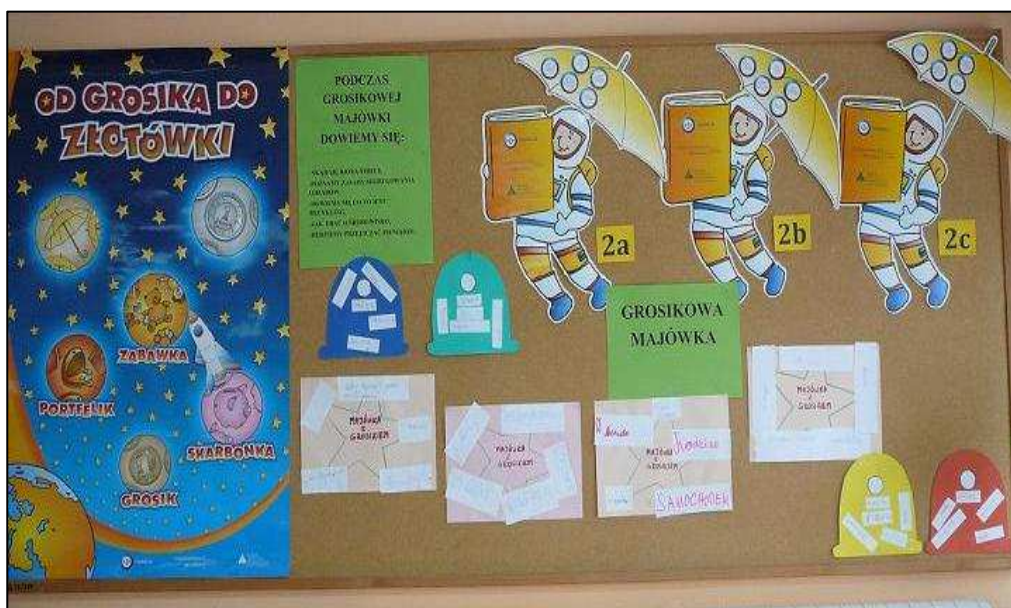
Podsumowanie piątej podróży.

Materiały zebrała i opracowała Barbara Roziewicz wych. kl. II a Zdjęcia p. B. Roziewicz, I. Choina i p. E. Białek