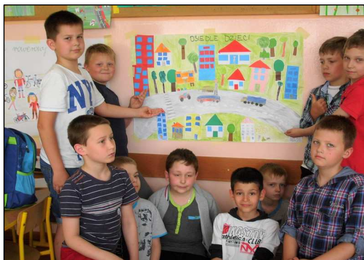
Osiedla wesołe, zadbane, czyste i przyjemne... prezentują uczniowie klasy II b.