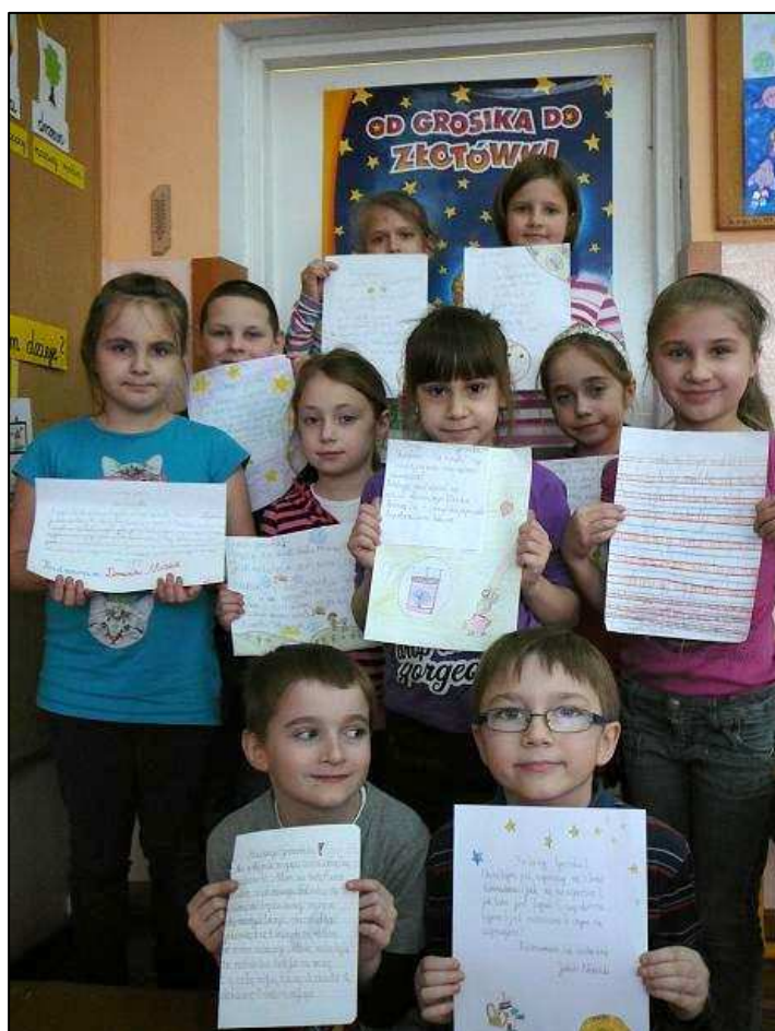
Uczniowie kl. II c prezentują listy.