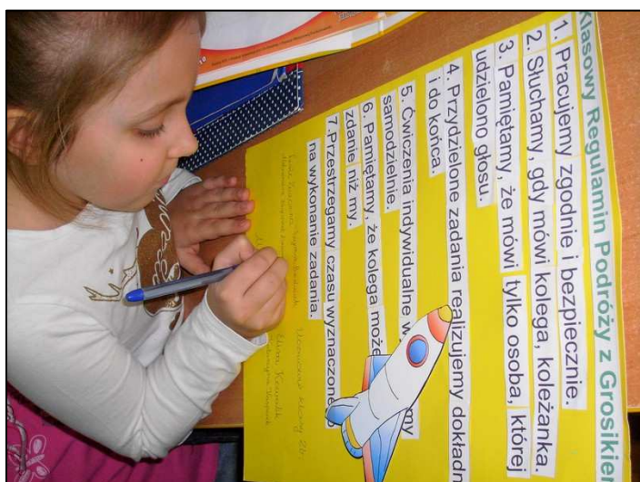
Uczniowie klasy II b podpisują regulamin.

W styczniu rozpoczęła się podróż. Dzieci poznawały różne pojęcia związane z pieniędzmi: moneta, banknot, nominał, bilon, a przede wszystkim – awers i rewers. Jednakże aby rozpocząć podróż, trzeba omówić i ustalić regulamin podróży.