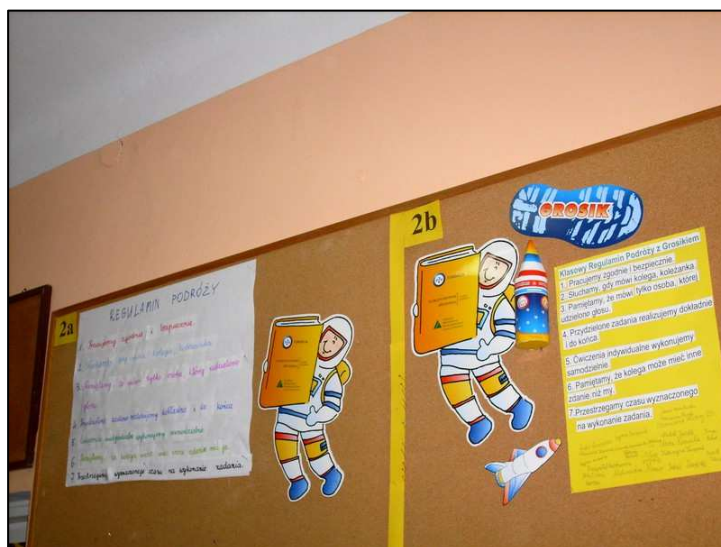
Gotowe regulaminy wiszą w widocznym miejscu.