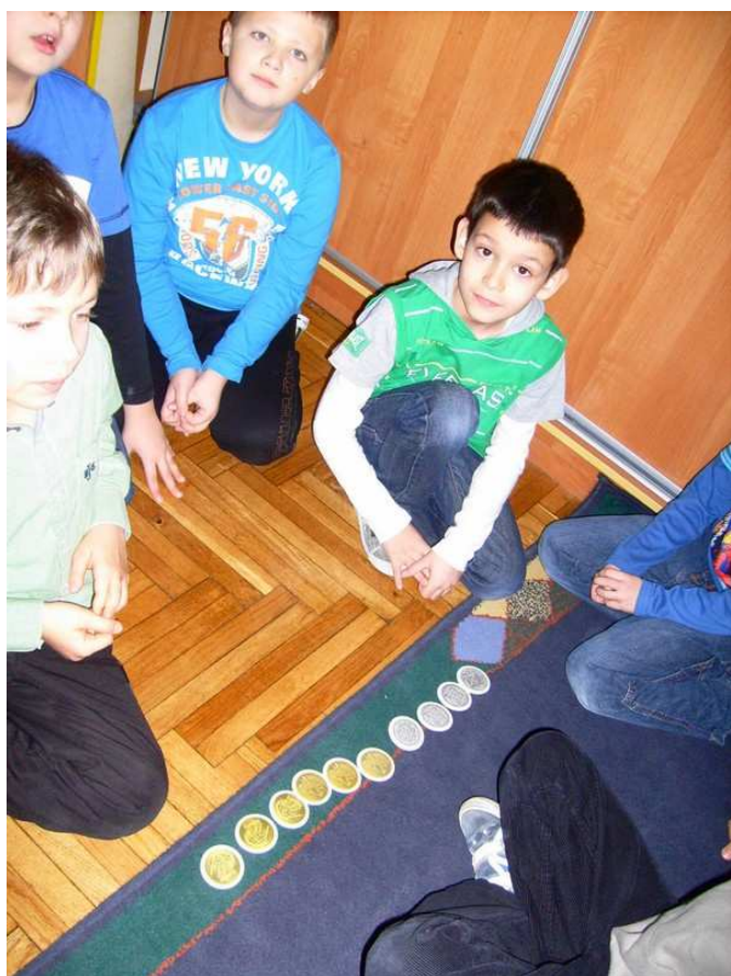
Chłopcy z kl. II b liczą pieniądze.